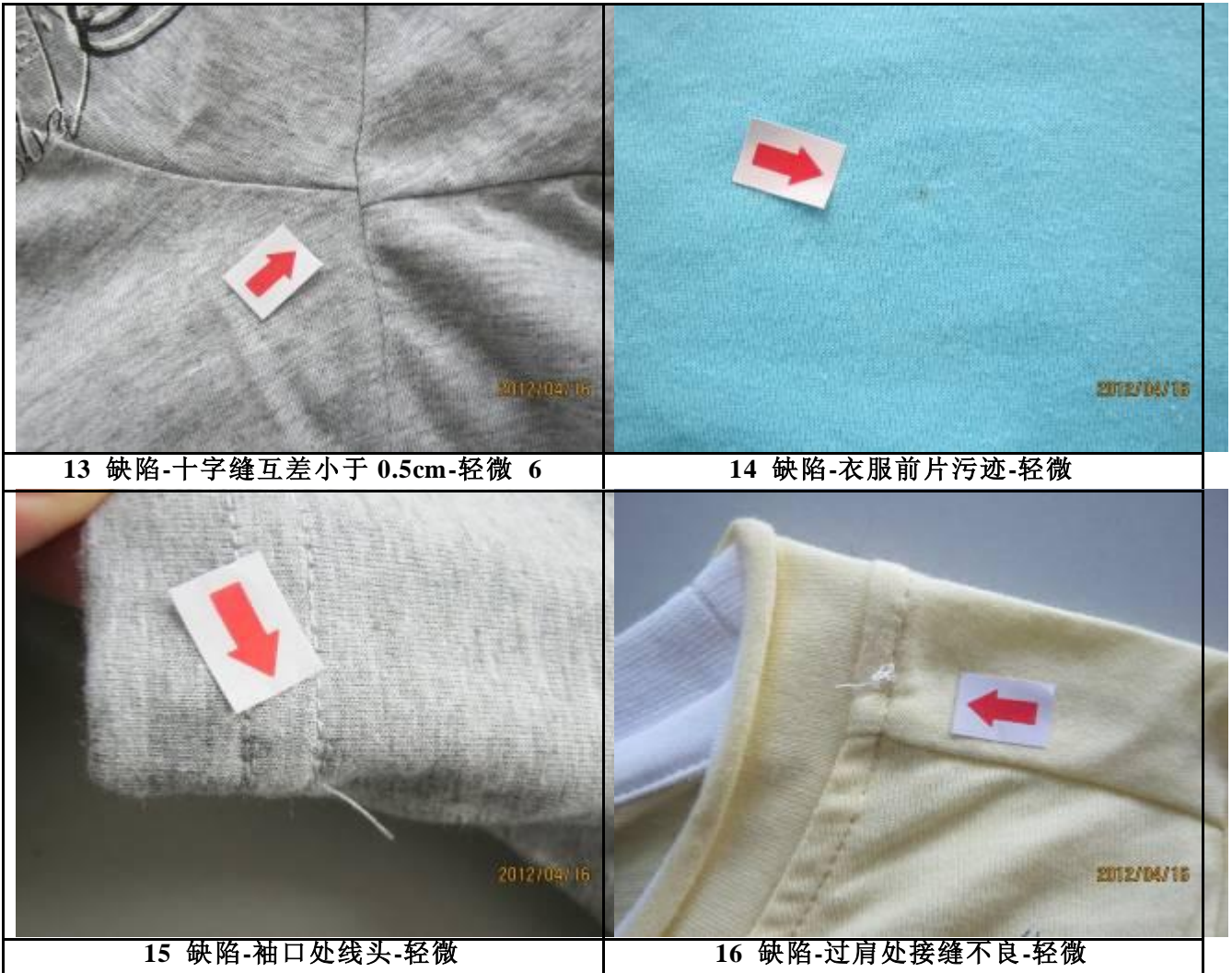
13 缺陷-十字缝互差小于 0.5cm-轻微 6