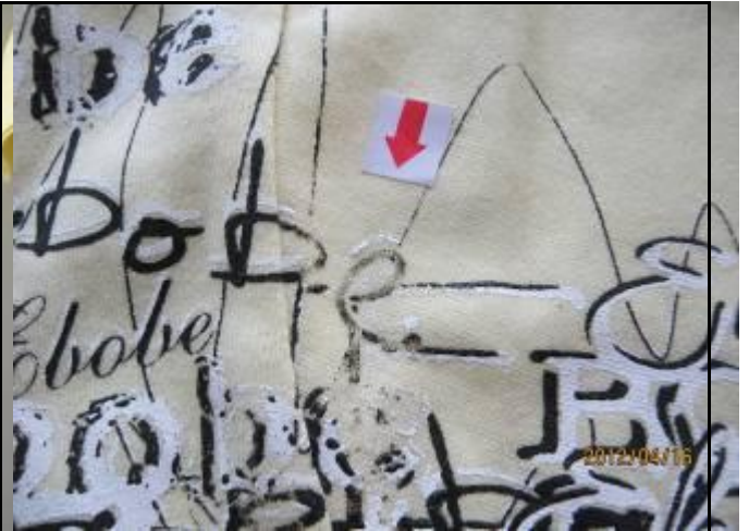
2 缺陷-印花不良-严重 1