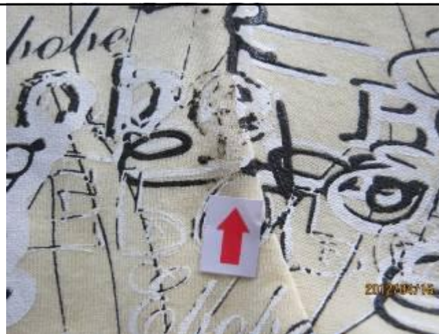
3 缺陷-印花不良-严重 2