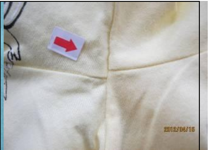
8 缺陷-十字缝互差小于 0.5cm-轻微 1