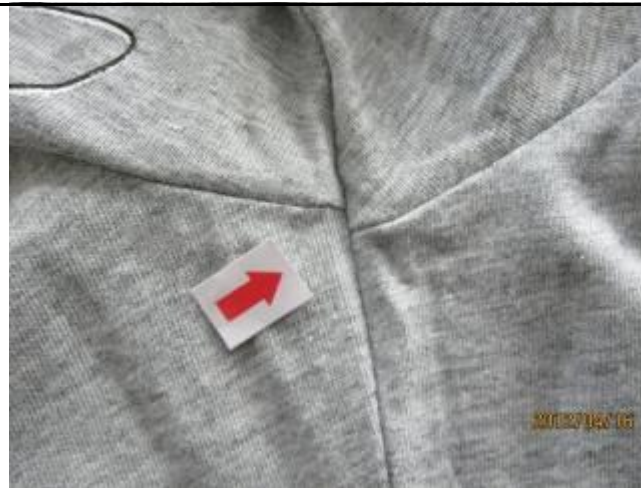
11 缺陷-十字缝互差小于 0.5cm-轻微 4