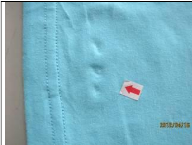
7 缺陷-压痕在袖口处-严重