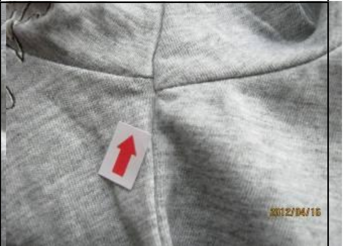
12 缺陷-十字缝互差小于 0.5cm-轻微 5