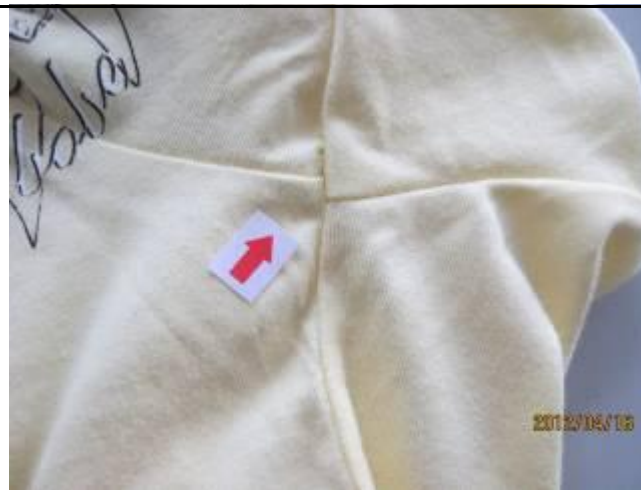
9 缺陷-十字缝互差小于 0.5cm-轻微 2