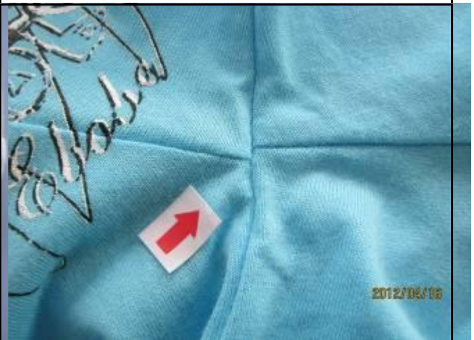
10 缺陷-十字缝互差小于 0.5cm-轻微 3