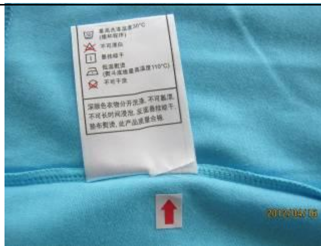
5 缺陷-洗标部分漏缝-严重 2