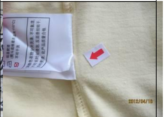
4 缺陷-洗标部分漏缝-严重 1