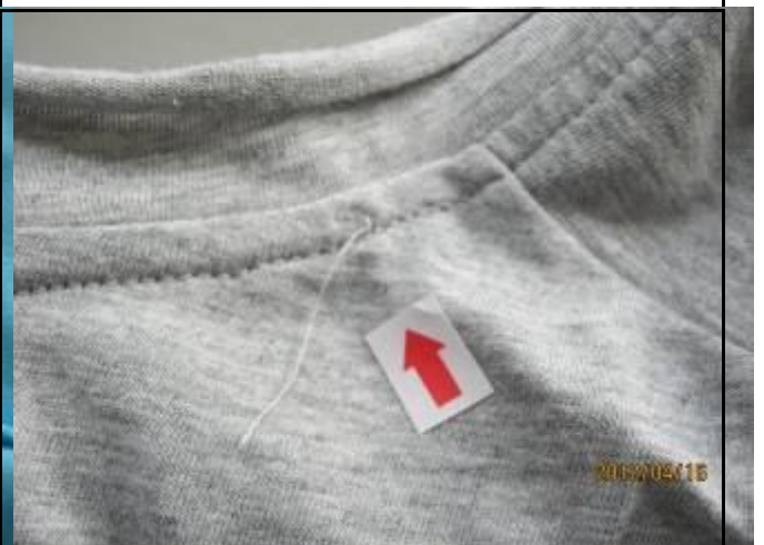
6 缺陷-线头在领子处-轻微