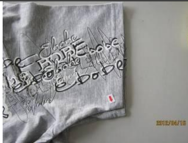
1 缺陷-左右袖口宽不一致(大于 0.3cm)-严重